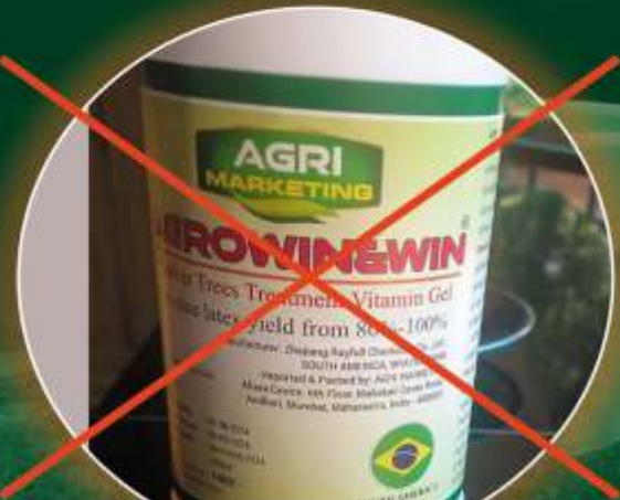
DUPLICATE OF AGROWIN