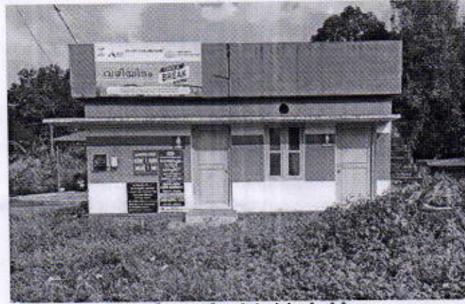
ടേക്ക് എ ബ്രേക്ക് ടോയ്ലറ്റ് പൂട്ടിയിട്ട നിലയിൽ

പഞ്ചായത്ത് ബസ് സ്റ്റാൻഡിൽ നിലവിലുണ്ടായിരുന്ന ടോയ്ലറ്റ് കോംപ്ലക്സ് ടേക്ക് എ ബ്രേക്ക് പദ്ധതിയുടെ ഭാഗമായി നവീകരിക്കുന്നതിന് 2020-21 വാർഷിക പദ്ധതിയുടെ ഭാഗമായി ശുചിത്വമിഷൻ ഫണ്ട് വകയിരുത്തി പ്രോജക്ട് ആവിഷ്കരിക്കുകയും സ്പിൽ ഓവറായി 2021-22 വർഷം (288/22)നടപ്പിലാക്കുകയും ചെയ്തു. പ്രോജക്ടിനായി 452371 രൂപ (18583/14.03.22) ആകെ ചെലവഴിച്ചിട്ടുണ്ട്. 15/11/21ൽ നിർമ്മാണം പൂർത്തീകരിച്ചുവെങ്കിലും ഒരു വർഷത്തിനു ശേഷവും ടോയ്ലറ്റ് കോംപ്ലക്സ് പൂട്ടിയിട്ട നിലയിലാണ്.